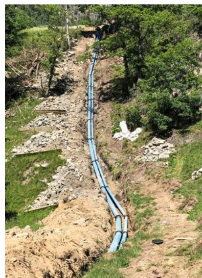
Leitung vor dem Verfüllen mit dem bestehenden Aushubmaterial im unwegsamen Gelände.