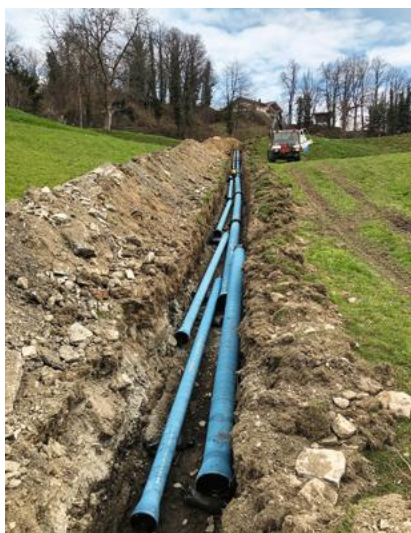
Bereitlegen der Rohre (Parallelleitung DN 250 und DN 150) und anschliessende Verlegearbeiten im Graben des leicht ansteigenden Geländes.

Beim Bau dieser Leitungen hat sich die Wasserversorgung Naters AG für den Einsatz des bewährten FZM-Rohres in Kom-