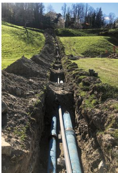
Teilverfüllte Leitung, bereit für die Druckprobe.